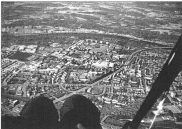
Die Großstadt unter den Füßen.

Rechtliche Vorschriften, man ist mit dem Paraglider dem Segelflieger gleich gestellt, müssen gelernt werden. Vor dem freien Flug sind drei Prüfungen abzulegen. Gerade deshalb ist die Unfallrate im Vergleich zu anderen Sportarten sehr gering. Für den Preis von einmal Bungeejumping kann man einen Test im Tandemflug machen, um festzustellen, ob es Spass macht. Dann folgt bei Gefallen der Grundschein mit dem ersten, kurzen aber schon atemraubendem Abheben.